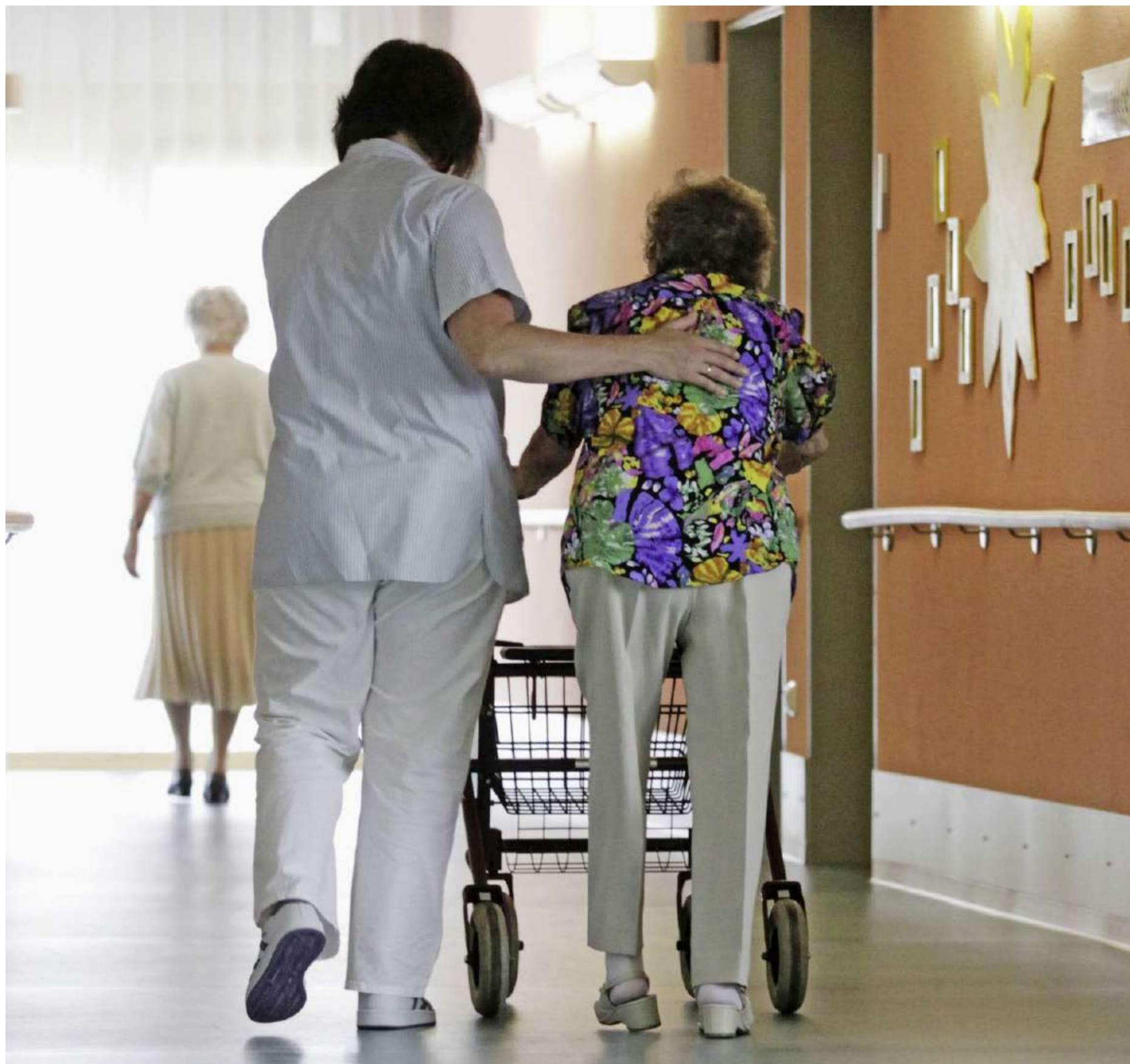
Eine betagte Frau wird von einer Pflegerin umsorgt: In Hunderten von Heimen in der Schweiz sieht die Realität anders aus